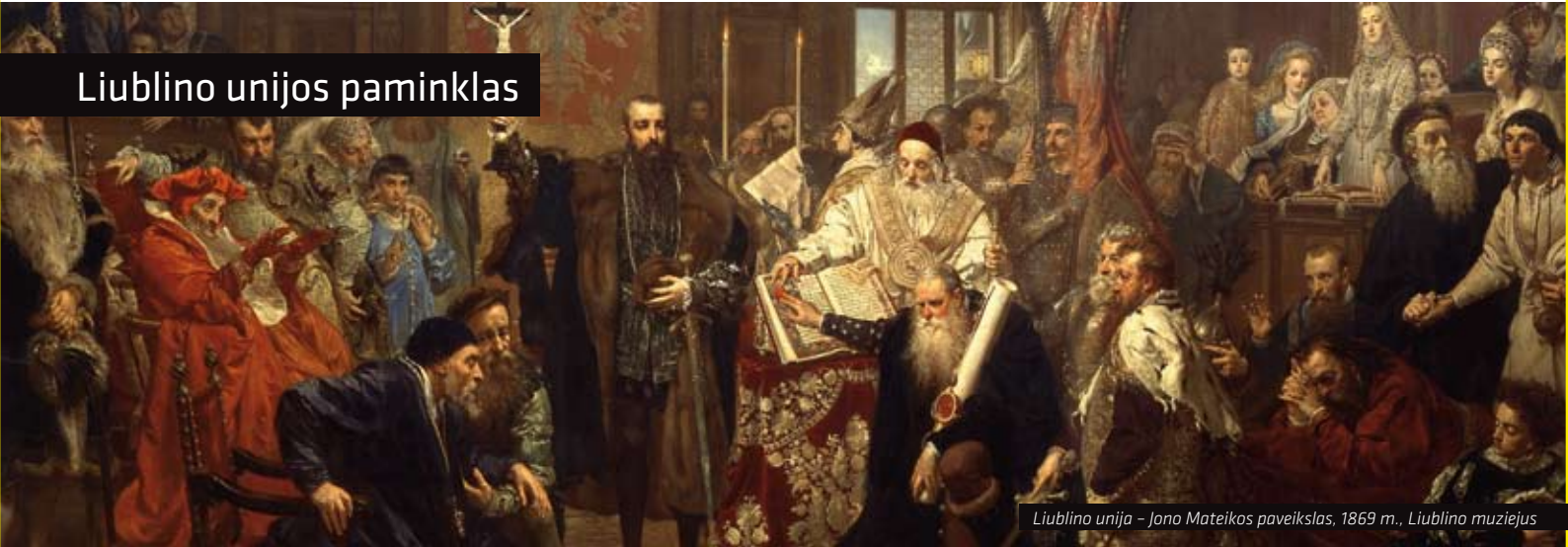
Liublino unija – Jono Mateikos paveikslas, 1869 m., Liublino muziejus

Šv. Stanislovo bazilika ir dominikonų vienuolynas