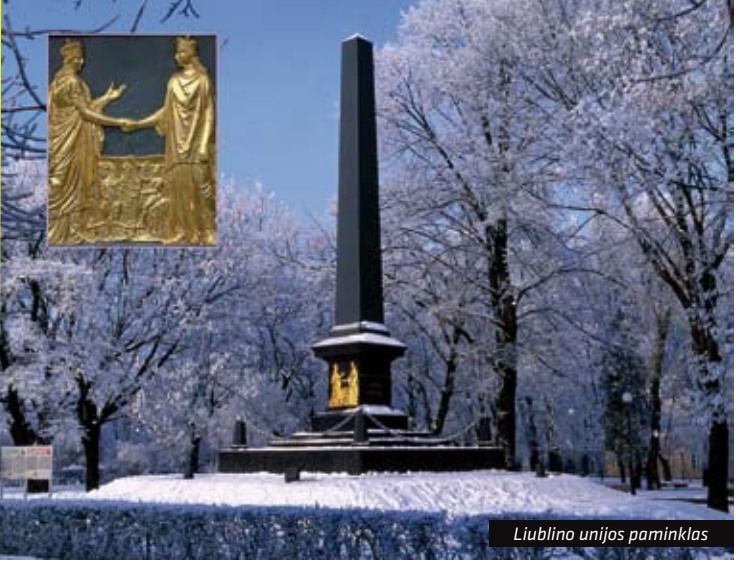
Liublino unijos paminklas