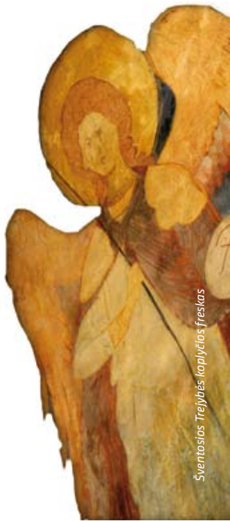
Sventosios Trejybės koplyčios freskas

Tarptautinio Teisingumo Teismo buveinė bei nacių stovykla Westerbork, esančiai šalies šiaurės rytuose dalyje Hooghalene. 2014 metų paieškoje šalys galinčios siųsti pasiūlymus, pateikė Europos Komisijai bendrai 36 kandidatūras. Europos ekspertų grupė rekomendavo priskirti Ženklą 16 kandidatūrų, be to Lenkija tai vienintelė šalis ES, kuri gavo net tris nominacijas (1791m. gegužės 3-sios Konstitucija, Gdanskio laivų statykla – objektai susiję su „Solidarumo“ susikūrimu bei Liublino Unija).