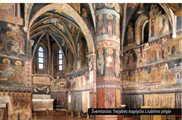
Šventosios Trejybės koplyčia Liublino pilyje