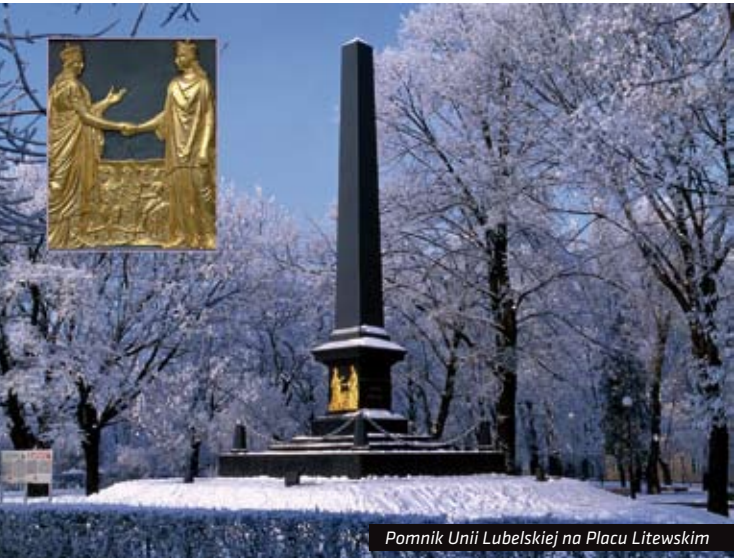
Pomnik Unii Lubelskiej na Placu Litewskim