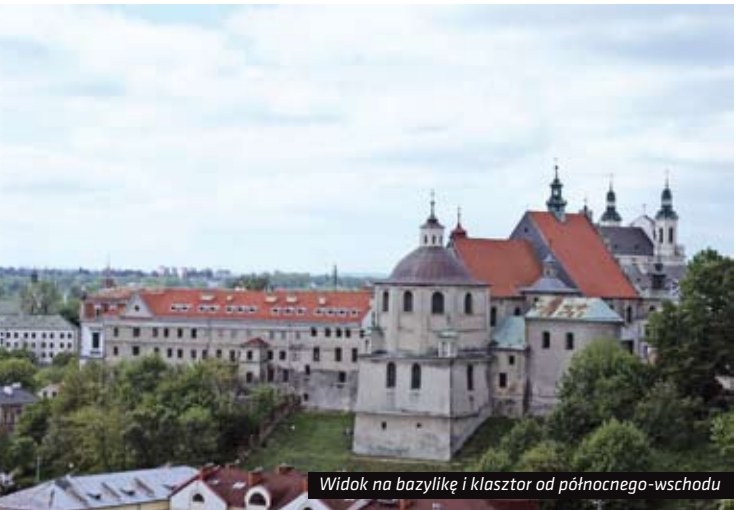
Widok na bazylikę i klasztor od północno-wschodu