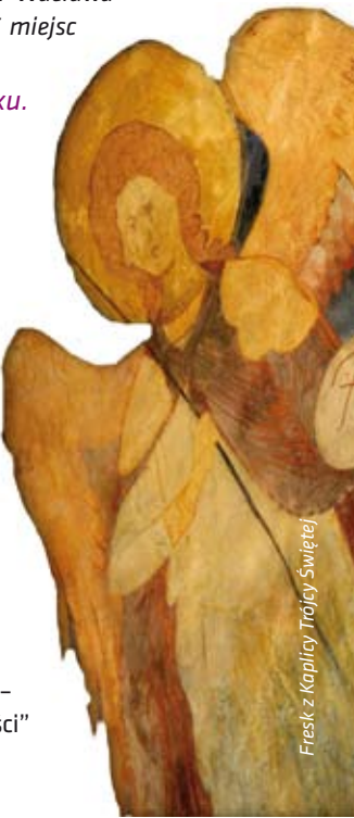
Fresk z Kaplicy Trójcy Świętej

w estońskim Tallinie oraz dwa miejsca w Holandii: Pałacowi Pokoju w Hadze, w którym mieści się siedziba Międzynarodowego Trybunału Sprawiedliwości oraz nazistowski obozowi przejściowemu z drugiej wojny światowej Westerbork, znajdującemu się w Hooghalen na północnym wschodzie kraju. W naborze 2014 r. państwa uprawnione do składania propozycji, przekazały do Komisji Europejskiej ogółem 36 kandydatur. Europejski panel ekspertów zarekomendował przyznanie Znak 16 kandydaturom, przy czym Polska jest jedynym krajem UE, który uzyskał aż trzy nominacje (Konstytucja 3 Maja 1791, Historyczna Stocznia Gdańska – obiekty związane z postaniem „Solidarności” oraz Unia Lubelska).