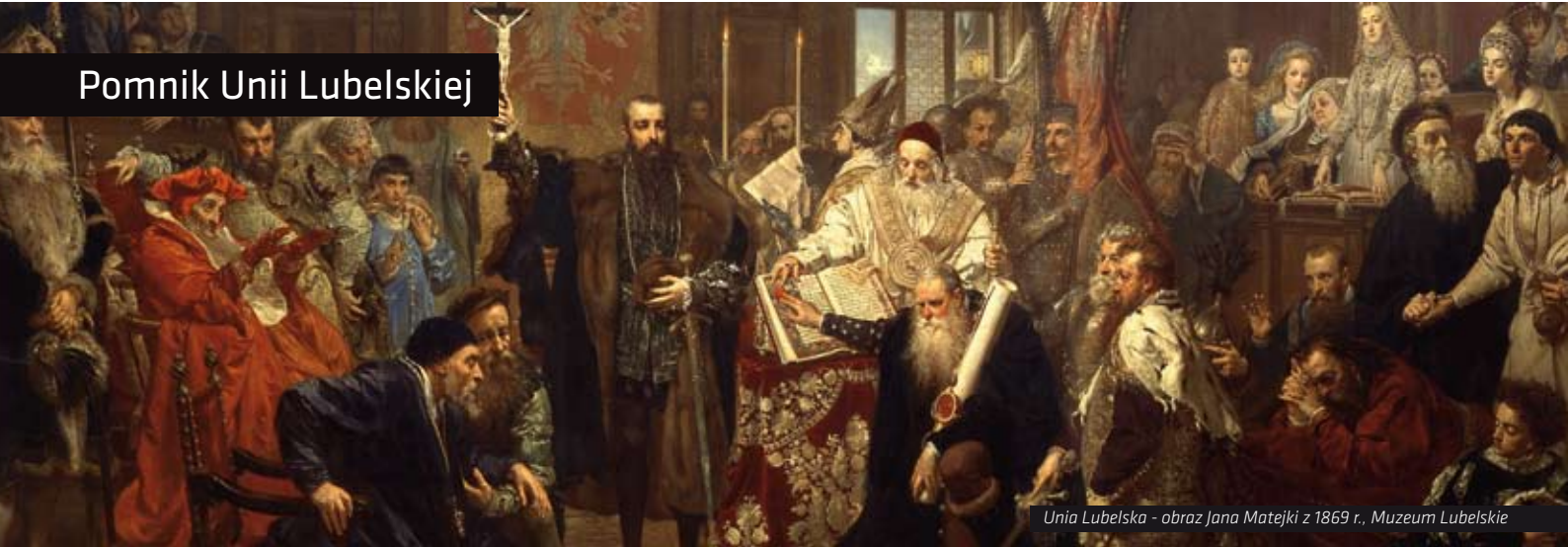
Unia Lubelska - obraz Jana Matejki z 1869 r., Muzeum Lubelskie