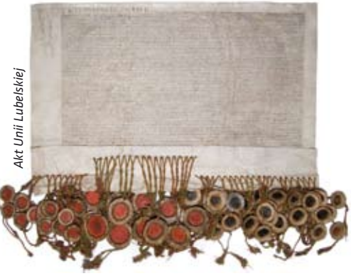
Akt Unii Lubelskiej

Celem Znak Dziedzictwa Europejskiego nie jest ochrona obiektów lecz promowanie ich europejskiego wymiaru, udostępnianie ich jak najszerszemu gronu odbiorców, w szczególności młodym ludziom, a także o zapewnienie wysokiej jakości informacji oraz organizację działań edukacyjnych i kulturalnych, podkreślających rolę i miejsce danego obiektu w historii Europy i integracji europejskiej. Znak Dziedzictwa Europejskiego może ponadto przynieść korzyści gospodarcze, wspomagając rozwój turystyki kulturalnej.