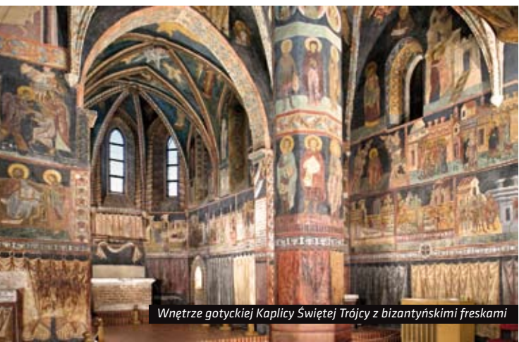
Wnętrze gotyckiej Kaplicy Świętej Trójcy z bizantyjskimi freskami