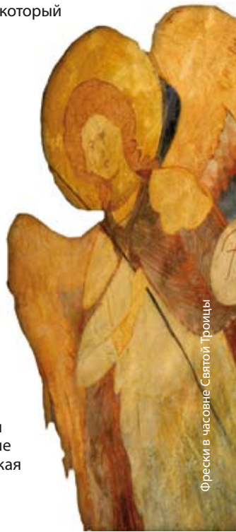
Фрески в часовне Святой Троицы

Нидерландах: Дворец мира в Гааге, в котором находится штаб-квартира Международного Суда и нацистский переходный лагерь Вестерборк из Второй мировой войны, находящийся в г. Хоогхален на северо-востоке страны. В наборе в 2014 году страны, имеющие право подавать свои предложения передали Европейской комиссии в целом 36 номинаций. Европейская панель экспертов рекомендовала предоставление Знака 16 кандидатурам, причем Польша является единственной страной ЕС, которая получила три номинации (Конституция 3 мая 1791 года, историческая Гданьская судоверфь – объекты, связанные с созданием «Солидарности» и Люблинская уния).