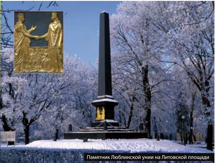
Памятник Люблинской унии на Литовской площади