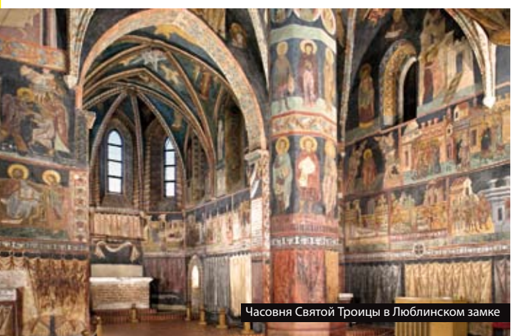
Часовня Святой Троицы в Люблинском замке