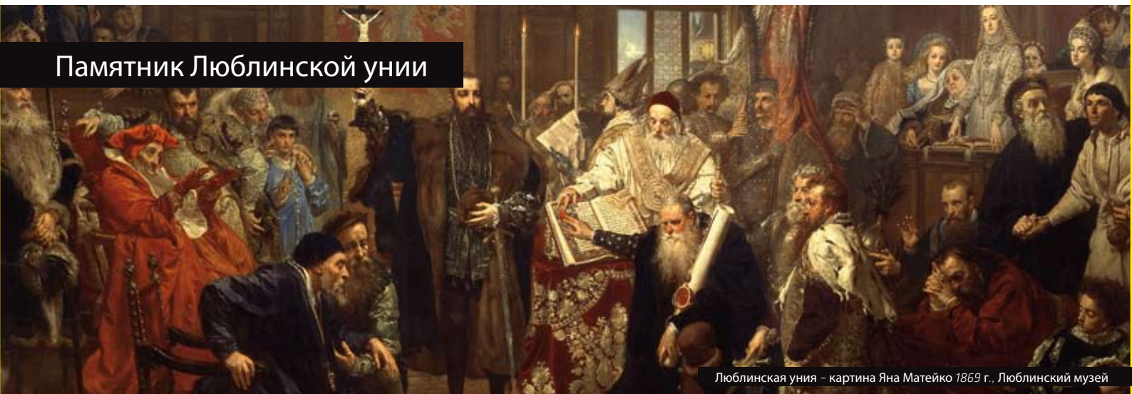
Люблинская уния – картина Яна Матејко 1869 г., Люблинский музей