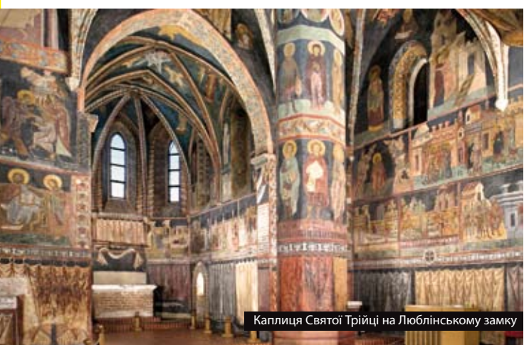
Каплиця Святої Трійці на Люблінському замку