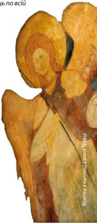
Фреска з каплиці Святої Трійці

В документації від 2014 року, держави, що мають право на складання заявок, запропонували Європейській комісії загалом 36 кандидатур. Європейська група експертів запропонувала присвоїти Знак тільки 16 кандидатам, при чому Польща є єдиною країною Євросоюзу, яка отримала аж 3 номінації (Конституція 3 травня, 1791 р., Історична гданська корабельня - об'єкти пов'язанні зі створенням «Солідарності» та укладенням Люблінської унії).