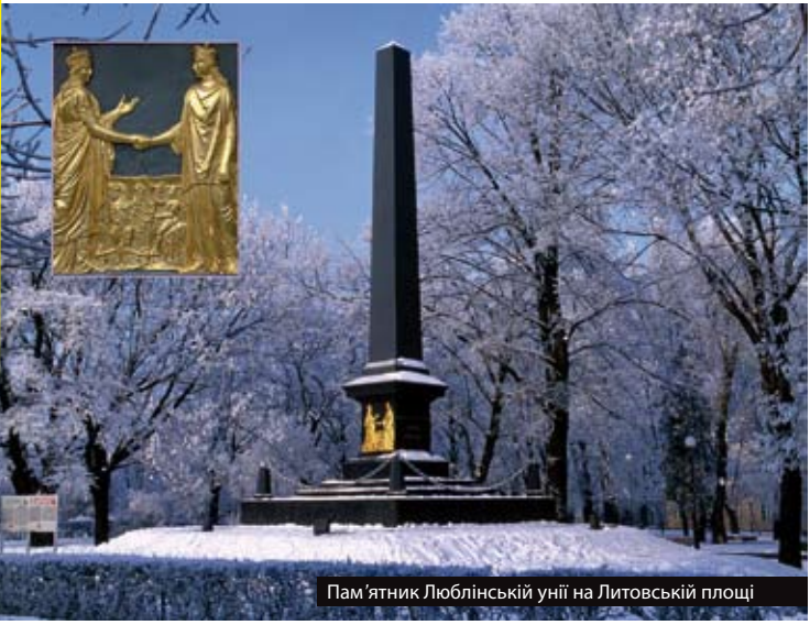
Пам'ятник Люблінській унії на Литовській площі