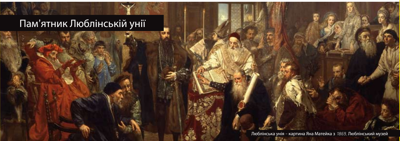
Люблінська унія – картина Яна Матейки з 1869, Люблінський музей