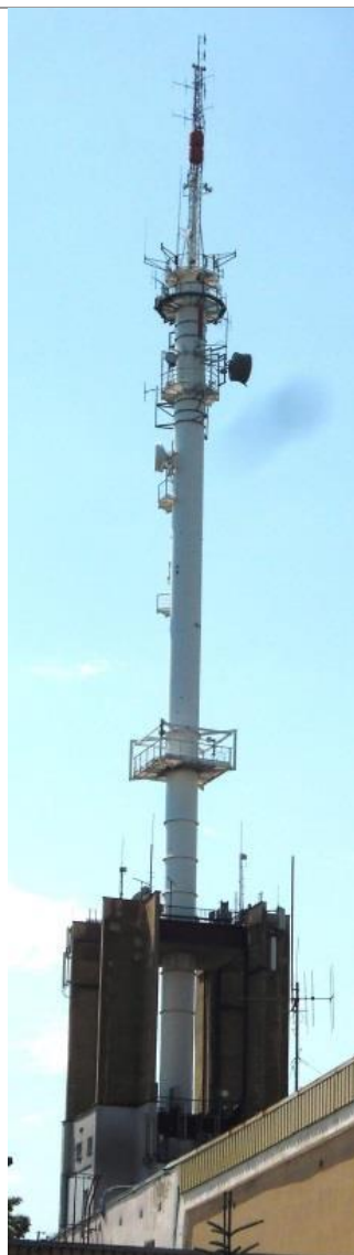
Fot. 1. RTON Lublin / Raabego – widok obiektu