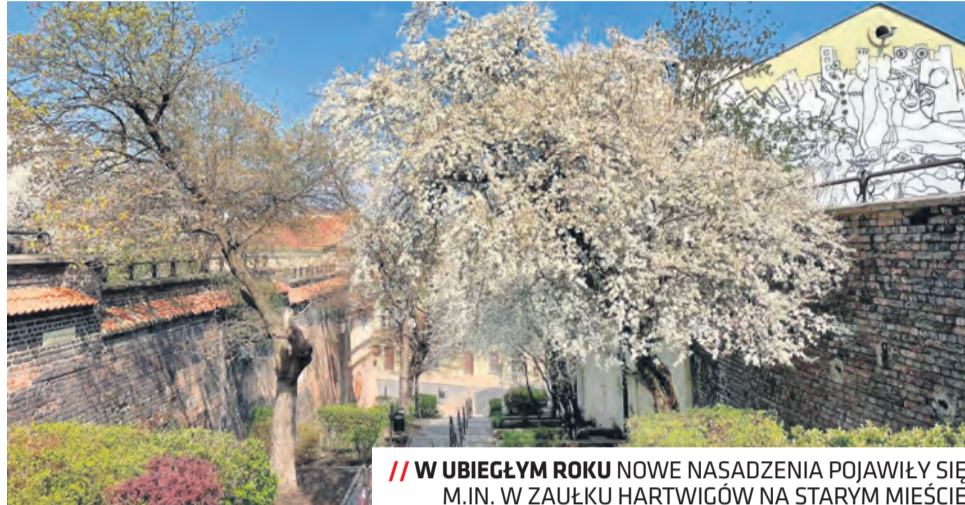
// W UBIEGŁYM ROKU NOWE NASADZENIA POJAWIŁY SIĘ M.IN. W ZAUŁKU HARTWIGÓW NA STARYM MIEŚCIE

ŚRODOWISKO | ZMIANY W CENTRUM LUBLINA I DZIELNICACH. JEST NOWY MIEJSKI ARCHITEKT ZIELENI