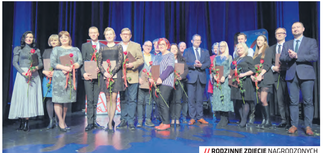
// RODZINNE ZDJĘCIE NAGRODZONYCH

Medale Prezydenta oraz Zastępcy dla Miasta Lublin otrzymało wiele osób tworzących lubelski teatr, zarówno twórcy zawodowi, jak i występujący na deskach amatorzy. Pełną listę nagrodzonych znaleźć można m.in. na stronie www.lublin.eu .