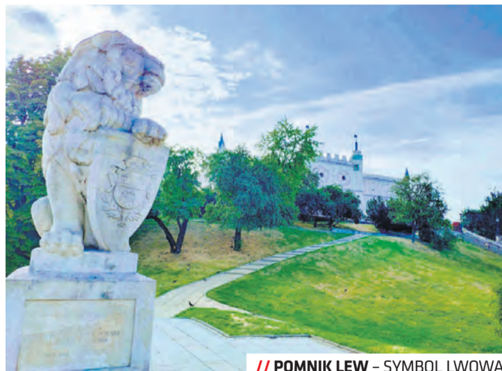
// POMNIK LEW – SYMBOL LWOWA

Pomnik składa się z figury lwa o wysokości 190 cm i 160 cm cokołu. Wykonano go na podstawie rzeźby lwów