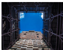
SEZON LUBLIN 2016