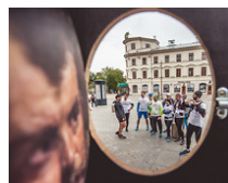
SEZON LUBLIN 2019