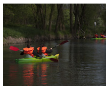
SEZON LUBLIN 2015