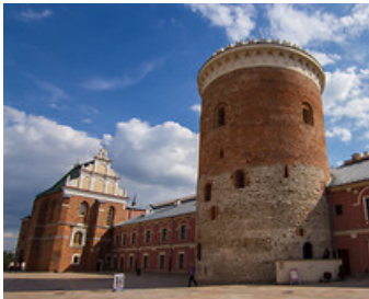
Bazta Zamkowa - Donżon