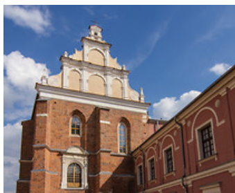
Kaplica Trójcy Świętej