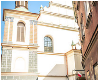
Bazylika oo. Dominikanów pw. św. Stanisława Biskupa i Męczennika