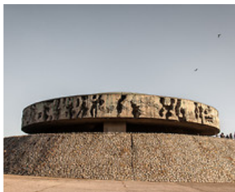
Państwowe Muzeum na Majdanku