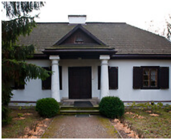
Садиба Вінсента Поля