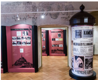
Літературний музей ім. Юзефа Чеховича