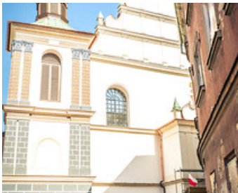
Базилика св. єпископа-мученика Станіслава і домініканський монастир