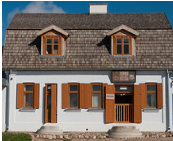
Музей Люблінського села