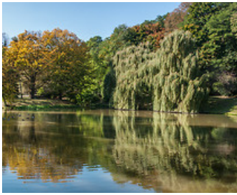
Ботанічний сад УМКС