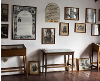
Єдина вціліла довоєнна люблінська божниця