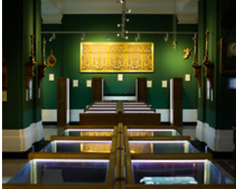
Музей старовинних гравюр і сакрального мистецтва