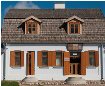
Музей Люблінського села