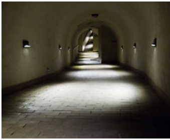
Люблінське підземне місто (вхід біля Коронного трибуналу)