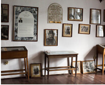
Єдина вціліла довоєнна люблінська божниця